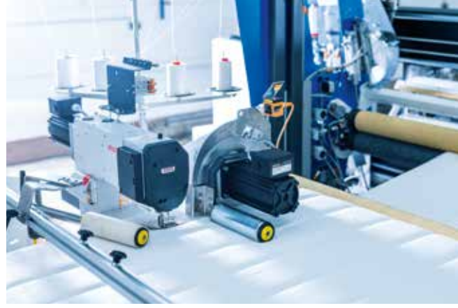
▲ Boyuna kapitone makinesi