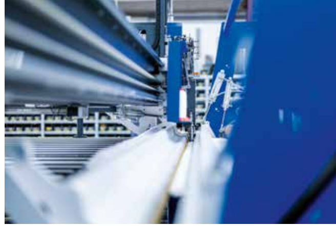
▲ Enine kapitone makinesi