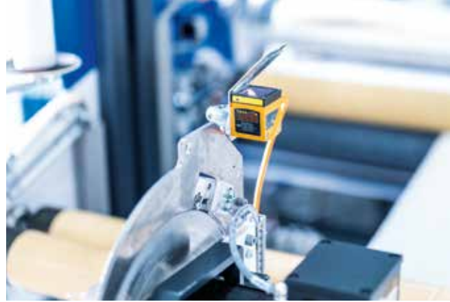
▲ Otomatik genişlik ayarı