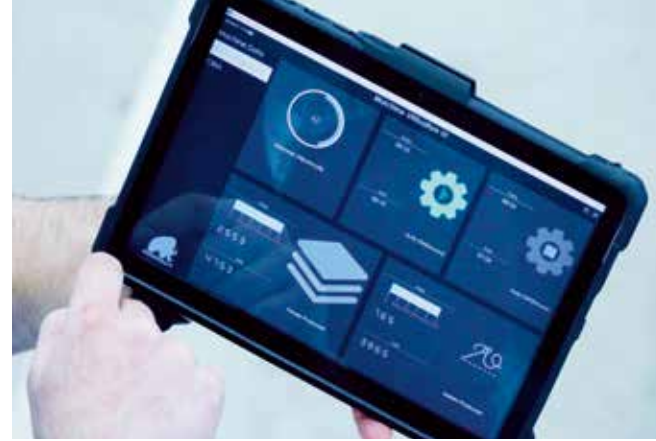
▲ Tablet kullanımı ve bağlanabilirlik