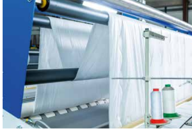
▲ entegre dansçı