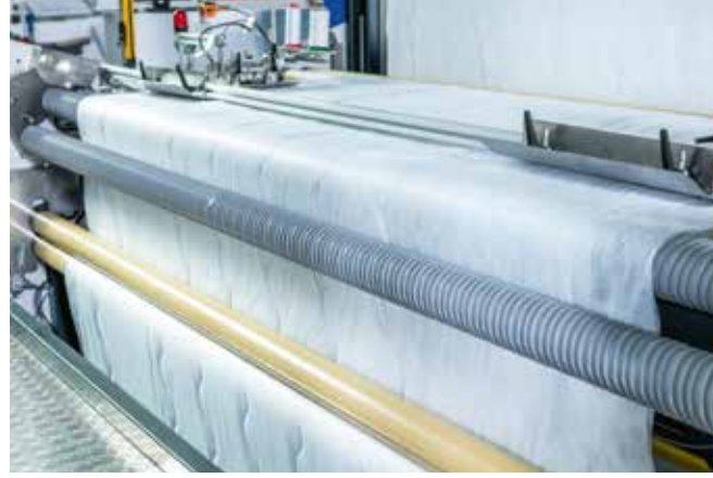
▲ Serpme silindiri