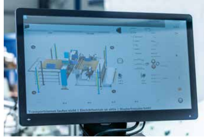
▲ modern dokunmatik kontrol