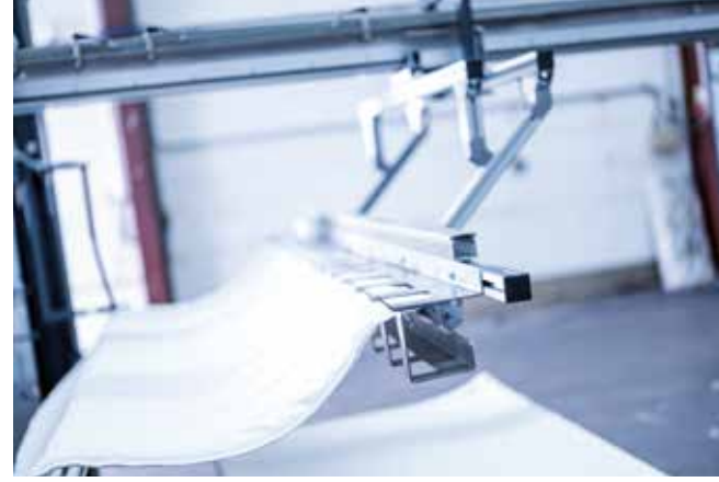
▲ Otomatik istifleyici