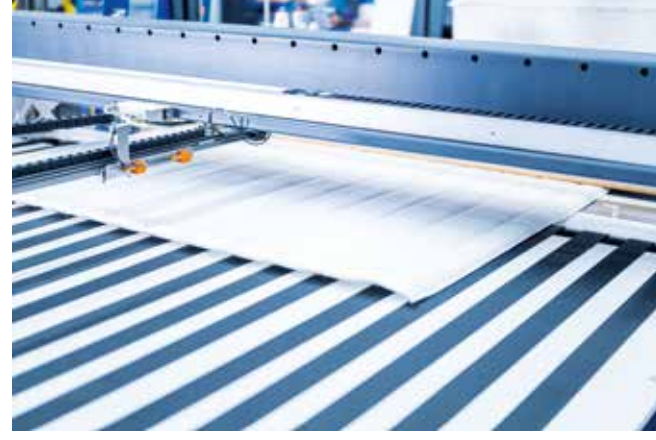
▲ Otomatik uzunluk ölçümü