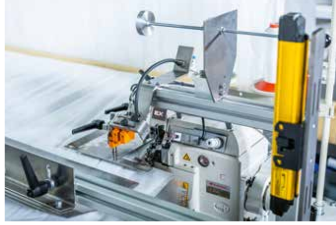
▲ Boyuna kapitone makinesi