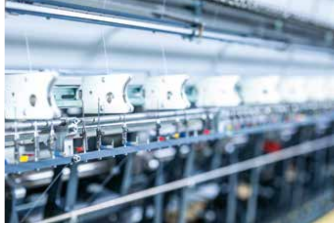
▲ Üst ve alt diş için diş kırılma sensörü