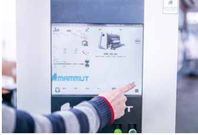
▲ Modern dokunmatik kullanım