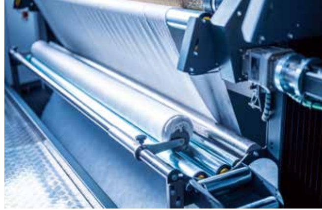
▲ Üst kumaş hızlı değiştirme sistemi