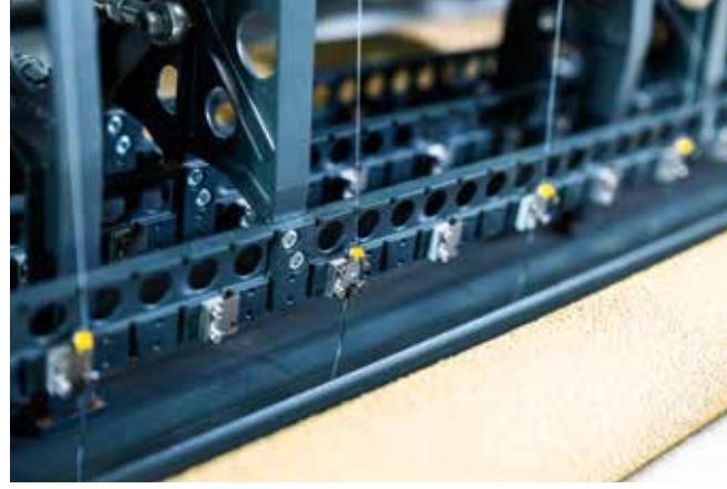
▲ Hızlı iğne ve kanca değişimi