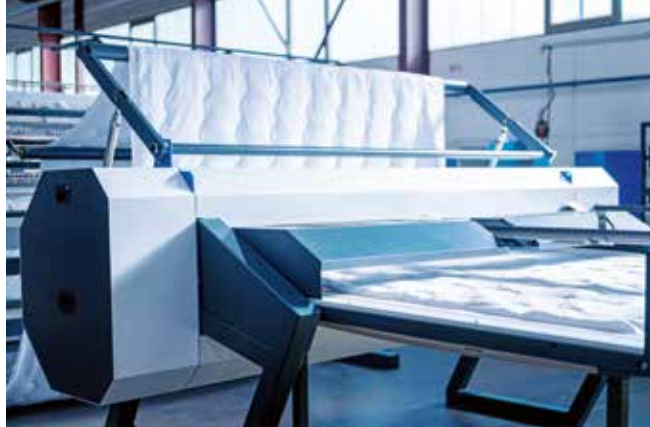
▲ Otomatik çapraz kesici