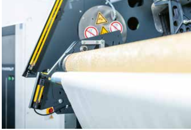
▲ Modern çalışma ve güvenlik konsepti